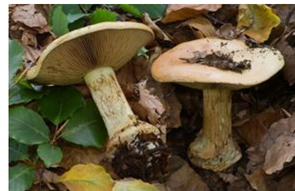
Guidonia M. (RM)

Il ruolo del micologo negli interventi presso ospedali e strutture di emergenza in occasione di sospetta intossicazione da funghi; metodi e procedure – tecniche di microscopia applicate alla micologia.